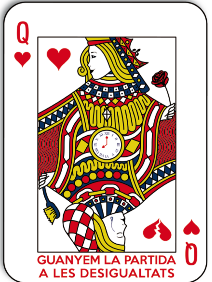
Obra guanyadora al IV Concurs de portades per la igualtat de gènere de la MICOD. Autor Adrián Haro Vergara

De dilluns a divendres de 9:30 a 19:30 h